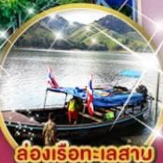
ล่องเรือทะเลสาบฮาลาบาลา

สตรีทอาร์ตเบตง, ตูโปรมณีโยโบราณ, สนามบินเบตง ปายใต้สุดสยาม อุโมงค์ปิยะมิตร ถ่ายรูปสุดเท่กับต้นไม้พันปี เจ้าแม่ลิ้มกอเหนี่ยว ต้นไม้พันปี หมิ่นบุปผา แซ่ก้าบ่อน้ำพุร้อนเบตง สวนหมื่นบุปผา, แซ่ก้าบ่อน้ำพุร้อนเบตง, พาชิมเวาก๊วยเบตง ลิ้มรส ไก่เบตง เคาหยก จิ้มจุ่มปลาไหลสายน้ำไหล