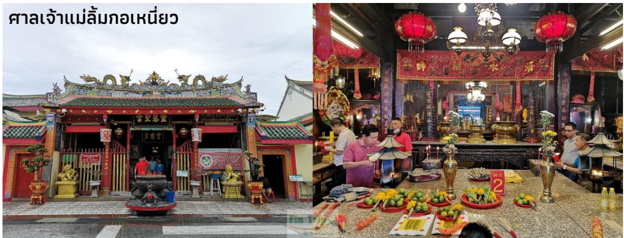
ศาลเจ้าแม่ลิ้มกอเหนี่ยว

จากนั้นนำท่านชม บ้านขุนพิทักษ์รายา สร้างขึ้นมาประมาณปี พ.ศ. 2460 อายุกว่า 100 ปี บ้านขุนพิทักษ์รายาเป็นเรือนแถว 2 ชั้น 2 คูหา 2 ช่วงเสา รูปแบบของตึกแถวมีการประยุกต์ระหว่างสถาปัตยกรรมในท้องถิ่นและสถาปัตยกรรมจีน ซึ่งมีความสำคัญทางประวัติศาสตร์การตั้งถิ่นฐานของชาวไทยเชื้อสายจีนในพื้นที่จังหวัดปัตตานีและเป็นภาพสะท้อนความเจริญรุ่งเรืองของย่านนี้ อีกทั้งยังมีการบันทึกกล่าวถึงตำแหน่งของบ้านขุนพิทักษ์รายาในสมัยรัชกาลที่ 5 เสด็จประพาส