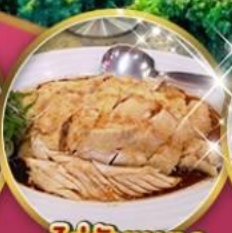
ไก่สับเบตง